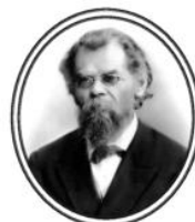
Григорий Николаевич Потанин (1835—1920)

Александра Викторовна Потанина - удивительная женщина, первая русская путешественница - исследователь Центральной Азии, жена и помощница ученого, писателя и общественного деятеля Григория Николаевича Потанина.